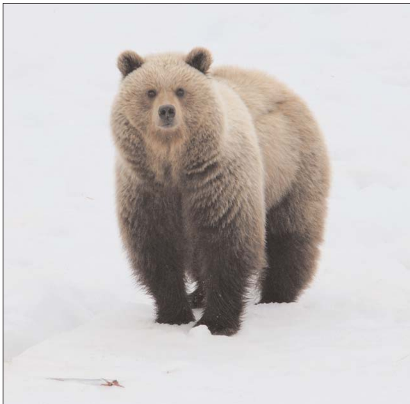
Медведь в нерешительности — стоит ли отогнать нарушителя спокойствия или лучше ретироваться самому. Бухта Пестрая Дресва, конец мая 2007 г.

Несмотря на действовавшие в те годы суровые ограничения на владение нарезным охотничьим оружием, многие таежные люди были вооружены винтовками и карабинами: работникам многочисленных экспедиций выдавалось ведомственное оружие, а промысловые охотники имели особые льготы на его приобретение и использование. Кроме того, что греха таить, на руках у жителей тайги было в то время и много подпольного, нигде не зарегистрированного, оружия, нередко оставшегося еще с дореволюционных и военных времен. Проконтролировать этих таежных людей власти не могли, а часто, вероятно, и не хотели. Для отстрела медведей в те годы не требовалось специальных лицензий, официально считалось, что нужно только соблюдать сроки охоты на этих зверей, к чему власти обычно относились не очень придирчиво. Ведь