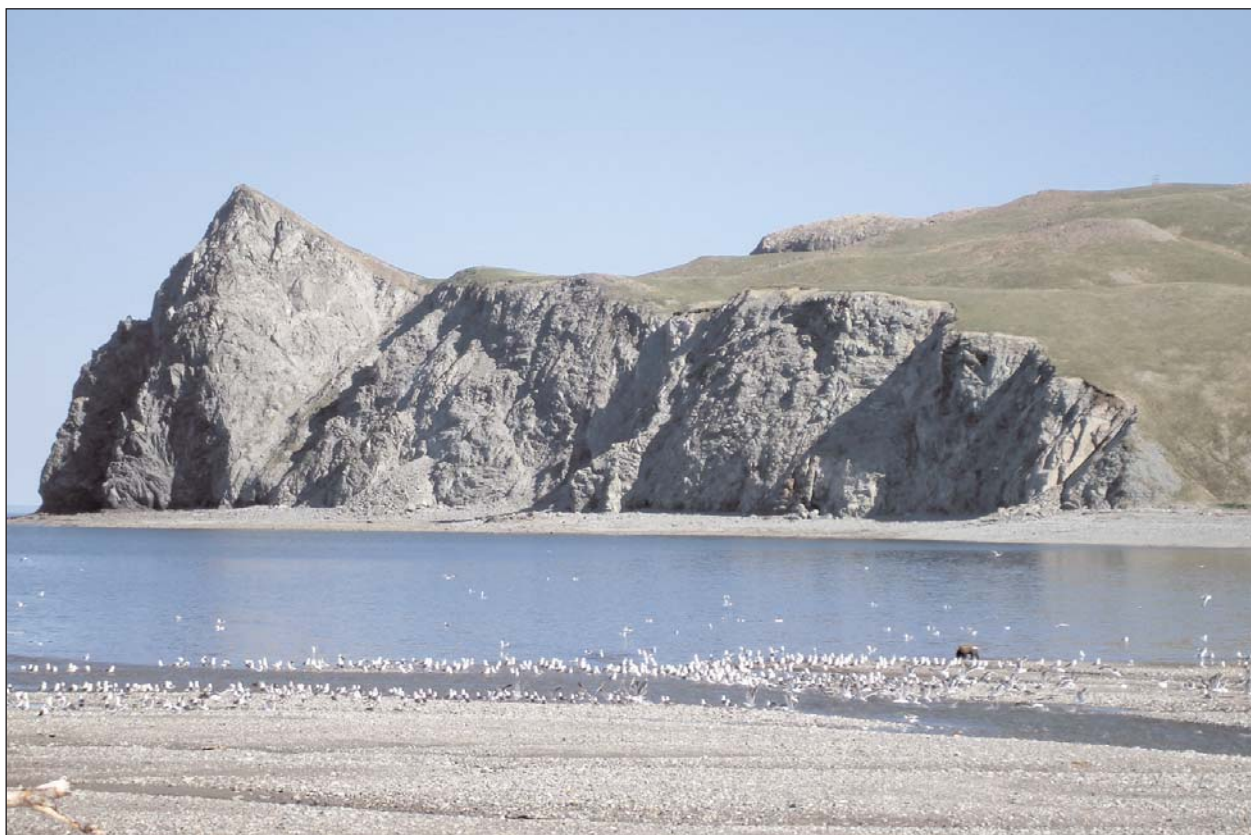
Залив Шелихова, мыс Надежды, июнь 2007 г. Особенно охотно медведи посещают устья ручьев, впадающих в дальневосточные моря.