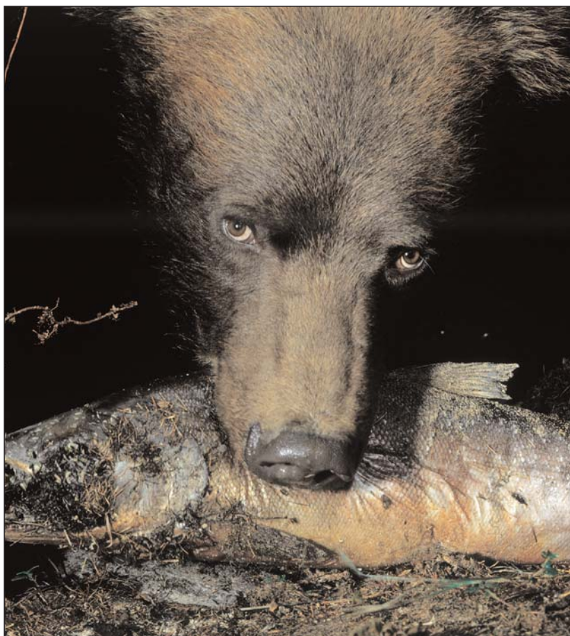
Портрет медведя с кетой. Бассейн р.Кава, июль 1994 г. Автоматические фотоаппараты, установленные на остатках добычи медведей, позволяют получать крупнопланные снимки, не беспокоя зверя.