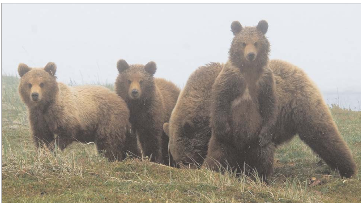
Медведица спокойно пасется в зарослях бобовых, а приближающимся человеком заинтересовались только годовалые медвежата. Полуостров Пьягина, июнь 2008 г.