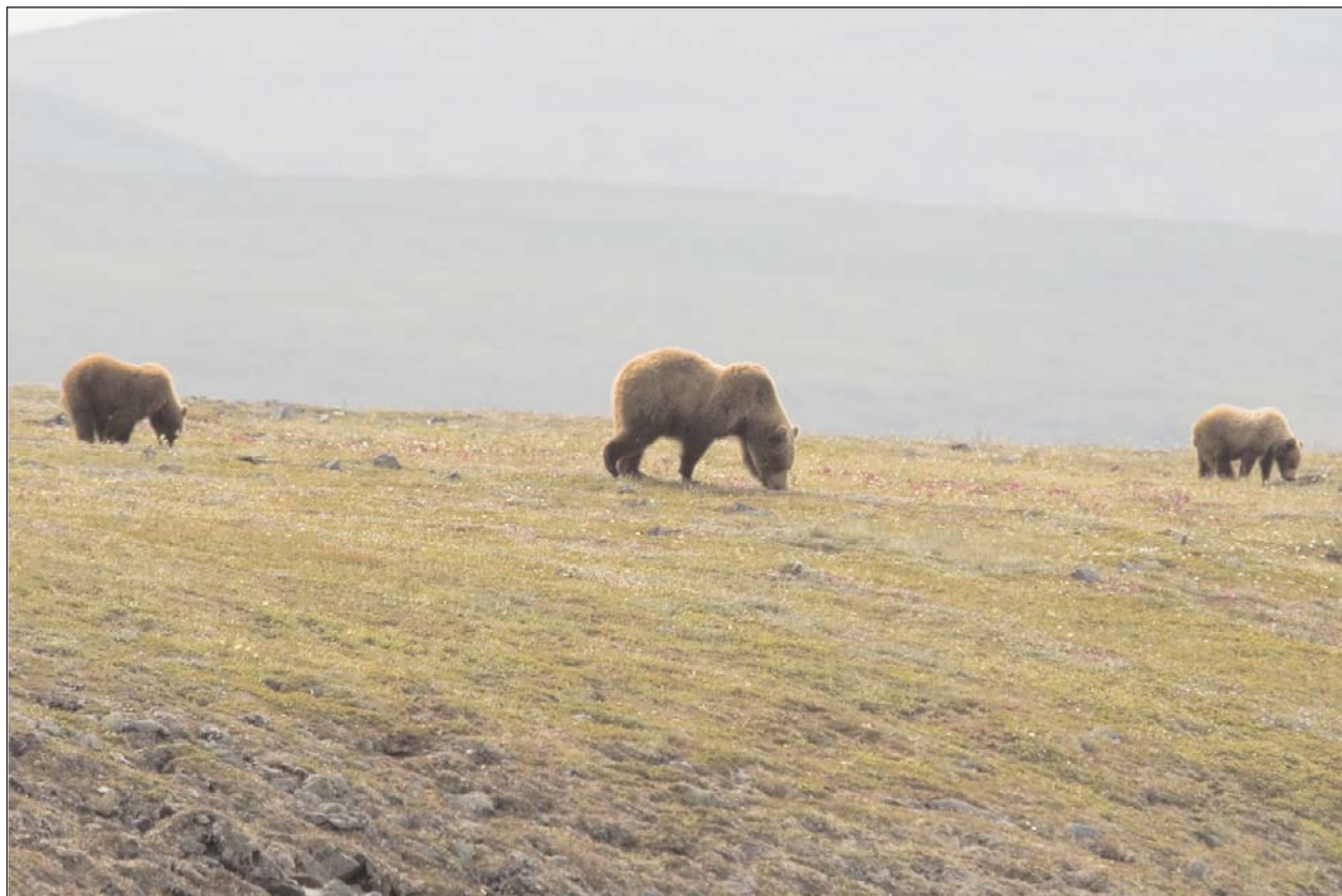
Медведи весь день пасутся в приохотской тундре, поедая стебли и соцветия бобовых. Полуостров Пьягина, июнь 2008 г.

годно работал в поле, что называется «от снега до снега» (не менее шести месяцев), хорошо, если удавалось увидеть медведя один-два раза за весь полевой сезон. Столь же осторожны были эти звери в начале 70-х и в среднем течении р.Омолон — наиболее крупного правого притока Колымы. Даже в верхнем течении Анадыря с богатыми нерестилищами кеты в августе—сентябре 1970 г. мне удавалось видеть медведей лишь изредка, самое короткое время и всегда в глубоких сумерках. Об отношении их к людям в те годы можно судить хотя бы на основании такого конкретного примера. Прилетев на вертолете 29 июня 1971 г. на побережье Внутреннего залива (п-ов Тайгонос) в совершенно безлюдное место, сразу после высадки за однодневную экскурсию я встретил 10 медведей. В дальнейшем мы работали в этом месте целый месяц, вре-