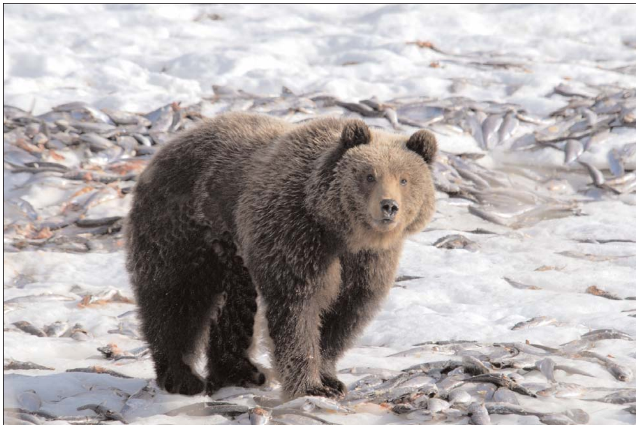
При таком изобилии пропадает всякая агрессивность. Бухта Пестрая Дресва, конец мая 2007 г.

фотоаппаратов у остатков добычи этих хищников, мы в 70-е годы совершенно безбоязненно совершали длительные экскурсии по самым «медвежьим» местам, не утруждая себя ношением тяжелого и неудобного ружья или карабина.